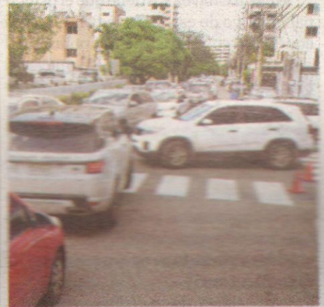
Calle José Amado Soler. J.ROTESTÁN

Winston Cnurnini, con los sectores Ser- rrallés, Piantini, Yolanda Morales y En- sanche Paraíso, al favorecer el flujo de las calles José Amado Soler, Filomena Gómez de Cova, Freddy Prestol Castillo, David Ben, entre otras. ● ELIANA LEDESMA