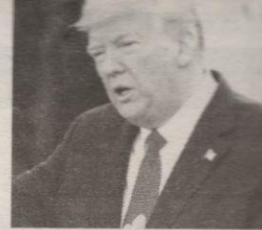
Presidente Donald Trump

"Ganó porque las Elecciones estaban Amañadas. No se permitieron OBSERVACIONES U OBSERVADORES VOTO, los votos fueron o