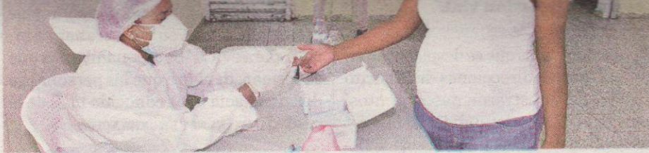
Durante el sábado y el domingo Salud Pública notificó la toma de 12,040 muestras. F.E

REPORTE. De acuerdo con las muestras PCR procesadas durante el fin de semana, unos 1,170 nuevos contagios a causa de la Covid-19 se suman a los 21,458 casos activos que hay en el país.