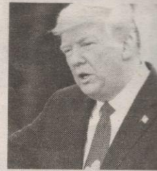
Presidente Donald Trump

"Ganó porque las Elecciones estaban Amañadas. No se permitieron OBSERVACIONES U OBSERVADORES VOTO, los votos fueron