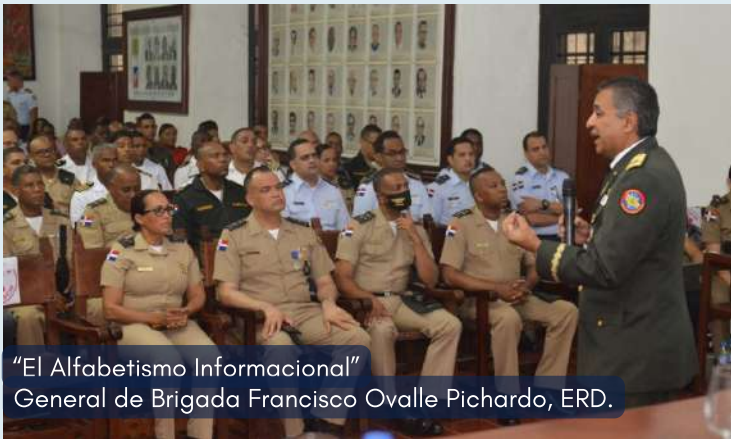
"El Alfabetismo Informacional" General de Brigada Francisco Ovalle Pichardo, ERD.