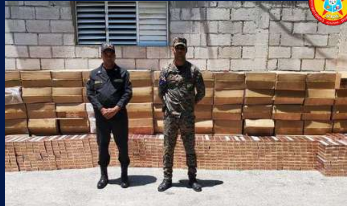
Decomiso de cigarrillo en el sur de la línea fronteriza