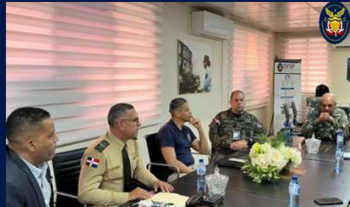
Superintendencia de Vigilancia y Seguridad Privada realiza reunión con docentes