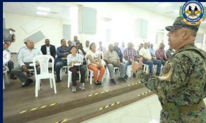
Junta de Retiro realiza Jornada Médico-Oftalmológica para retirados de las FF.AA.