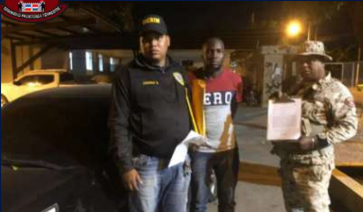
Miembros del CESFront detienen nacional haitiano y recuperan vehículo robado