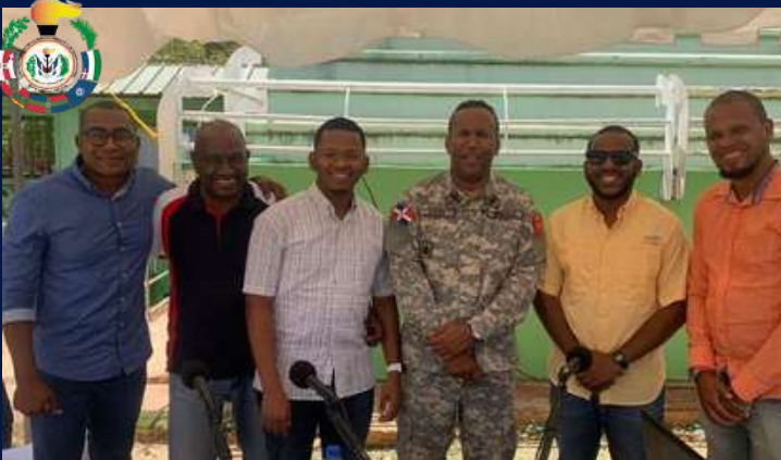
Deportes al Mediodía realiza con éxito programa especial desde Juegos Deportivos Militares 2023