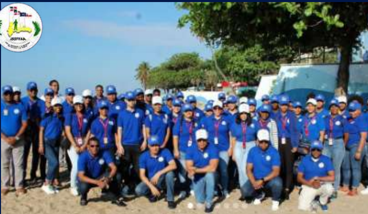
ISSFFAA realiza jornada de limpieza y reciclaje