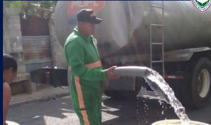
Comipol está presente en la jornada social del MOPCRD en Los Alcarizos