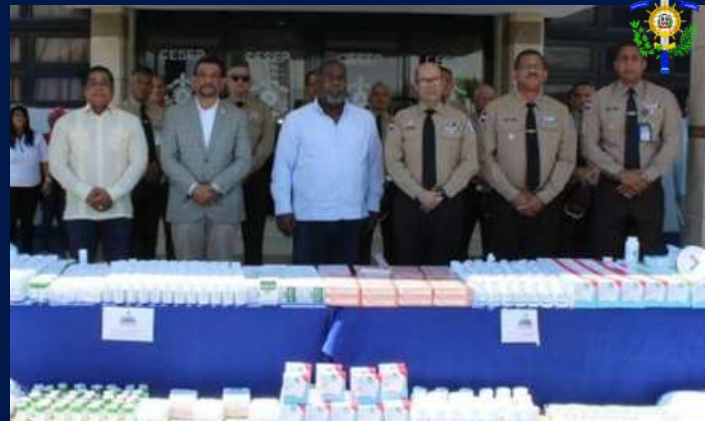
Donación de insumos médicos y medicamentos al CESEP