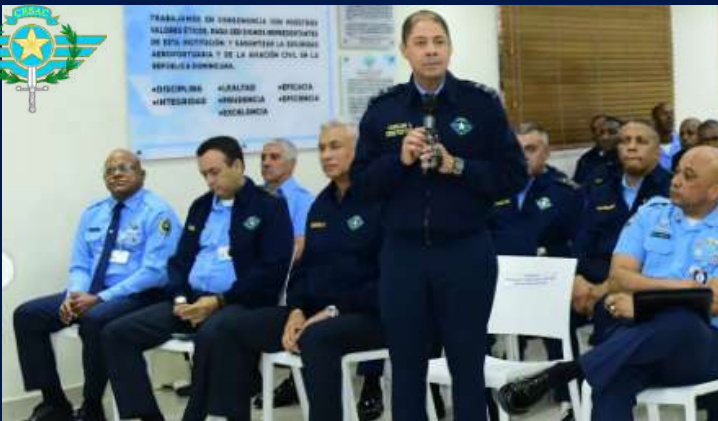
DGA capacita colaboradores del CESAC en Ley General de Aduanas