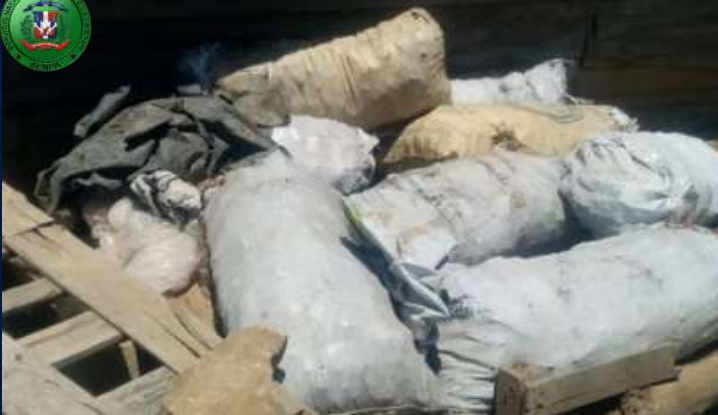
SENPA incauta sacos de carbón vegetal