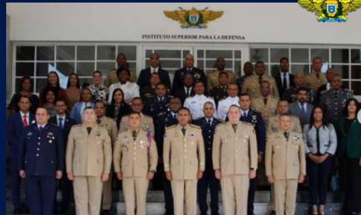
MIDE a través del EGAAE recibe XXIX Promoción de la Maestría en Seguridad y Defensa Nacional