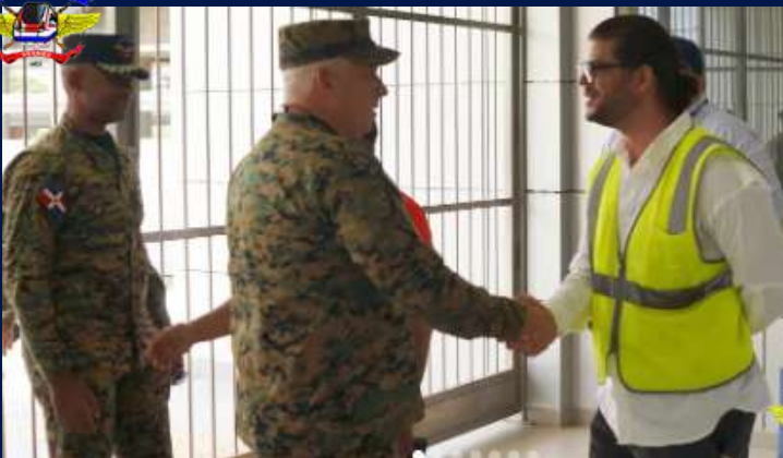
Recorrido por las instalaciones del teleférico de Los Alcarrizos