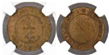
Año: 1844 Material: Latón