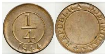
Año: 1844 Material: Bronce