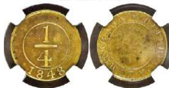
Año: 1848 Material: Bronce