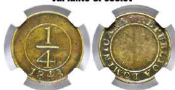
Año: 1848 Material: Bronce